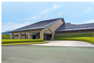
クラブハウス正面