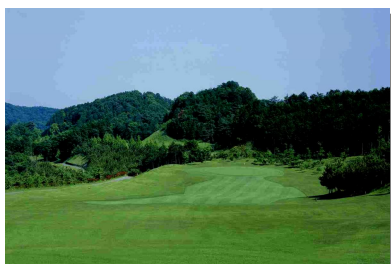
アゼリアヒルズCC (栃木県)

OGMでは、女性に優しいコースとして、フラットで距離も短く池が一つもない「アゼリアヒルズカントリークラブ」(栃木県栃木市)や、女子風呂にジャグジーを備え付けた「富士OGMエクセレントクラブ御嵩花トピアコース」(岐阜県可児郡)などハード面で充実したコースがあるほか、ソフト面でも女性のための貸切コンペを定期的で開催しているコースや、女性用有名ブランドシャンプーを多数取り揃えているコースも複数あり、さまざまなサービスをさまざまなコースでご用意しております。本格的なゴルフシーズンに、本キャンペーンをご利用いただき、ぜひご来場ください。